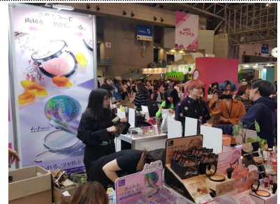
< KCON 2019 JAPAN 컨벤션 중소기업 판촉부스 현장 >