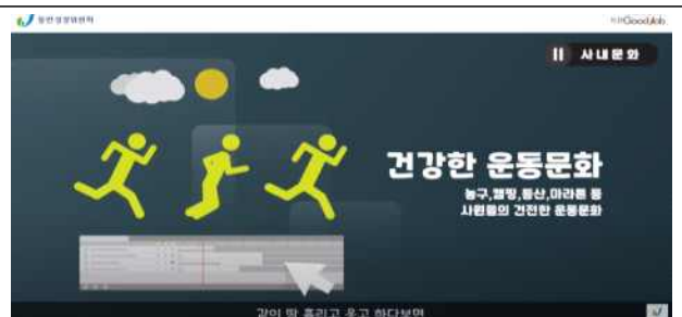
(일반 촬영) 기업 홍보 영상 예시