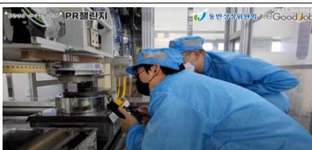
유튜버 기업 탐방 영상 예시